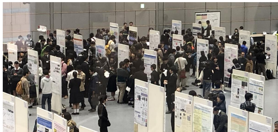
年次大会での高校生ポスターの様子